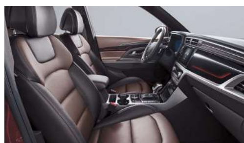
Hnědý kožený paket interiér (OAY)