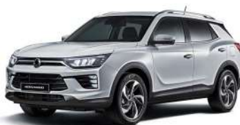
SILENT stříbrná (SAI)