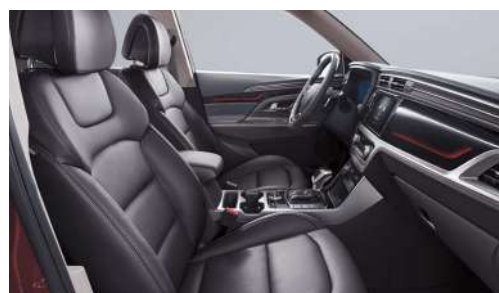
Černý interiér (LBH)