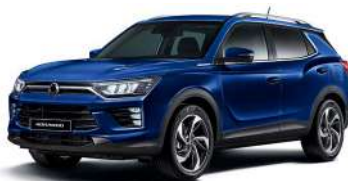
DANDY modrá (BAS)