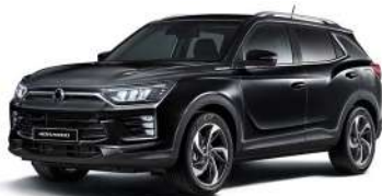
SPACE černá (LAK)