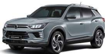
PLATINA šedivá (ADA)