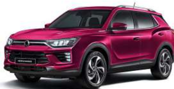
CHERRY červená (RAV)