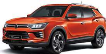
REDDISH oranžová (RAT)