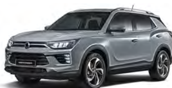
PLATINA šedivá (ADA)