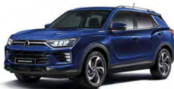
DANDY modrá (BAS)