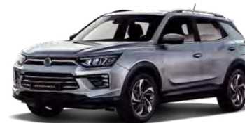
IRON kovová (ADE)