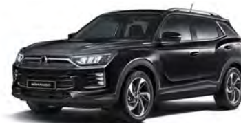
SPACE černá (LAK)