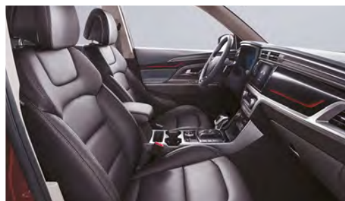
Černý interiér (LBH)