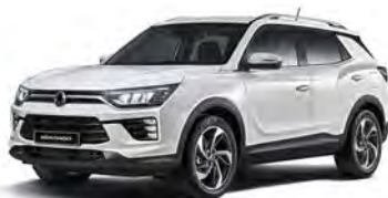
GRAND bílá (WAA)