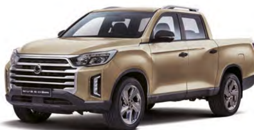
Metalická barva SAND béžová (EBK)