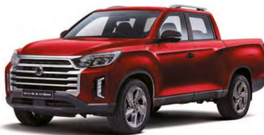
Metalická barva INDIAN červená (RAJ)