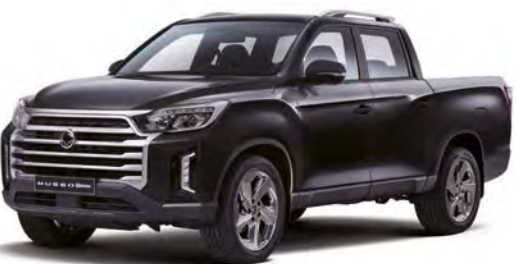
Metalická barva SPACE černá (LAK)