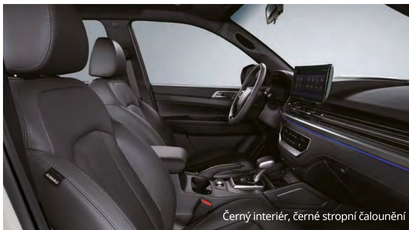
Černý interiér, černé stropní čalounění