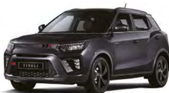
Metalická barva SPACE černá (LAK)