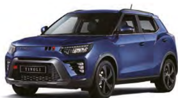
Metalická barva DANDY modrá (BAS)