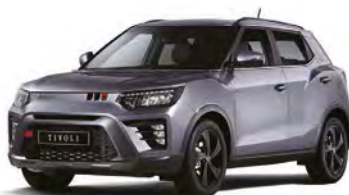
Metalická barva IRON kovová (ADE)