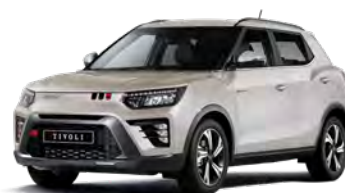
Metalická barva LATTE béžová (EBL)