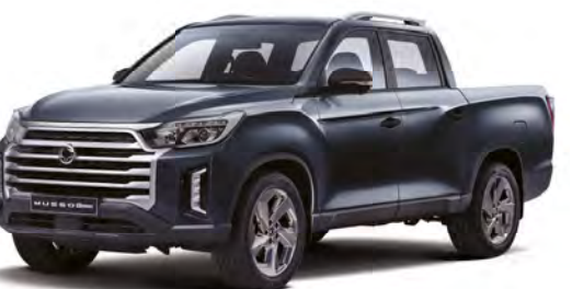
Metalická barva GALAXIES šedá (ADB)