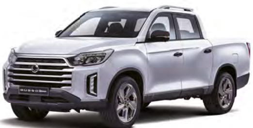
Metalická barva PEARL bílá (WAK)