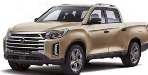
Metalická barva SAND béžová (EBK)