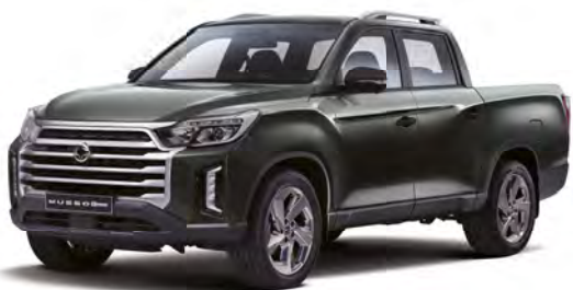
Metalická barva AMAZONIA zelená (GAM)