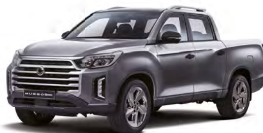
Metalická barva MARBLE gra tová (ACM)