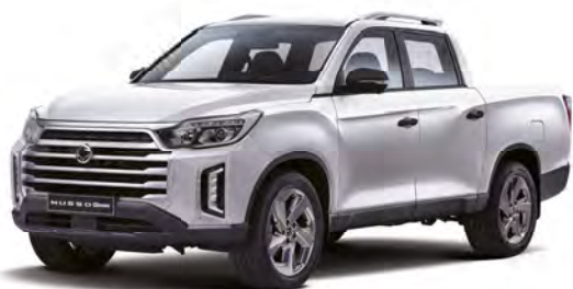
Základní barva GRAND bílá (WAA)