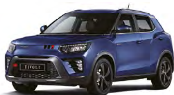
Metalická barva DANDY modrá (BAS)