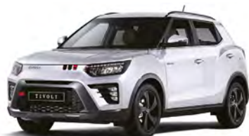
Základní barva GRAND bílá (WAA)