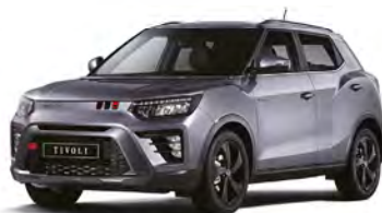
Metalická barva IRON kovová (ADE)