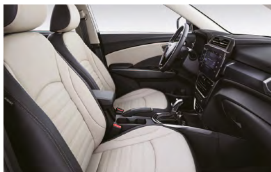
Světle šedý dvoutónový interiér (EBG)*

*Foto je pouze ilustrativní, na českém trhu je v nabídce pouze textilní potah sedadel.