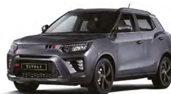
Metalická barva PLATINUM šedá (ADA)