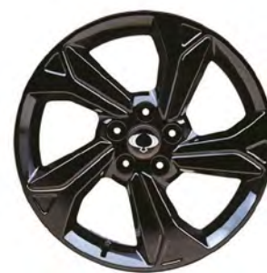
18" černá ALU kola "Diamond Cutting", pneumatiky 215/50 R18