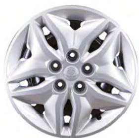
16" ocelová kola, pneumatiky 205/65 R16