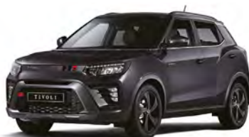
Metalická barva SPACE černá (LAK)