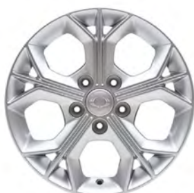
16" ALU kola, pneumatiky 205/65 R16