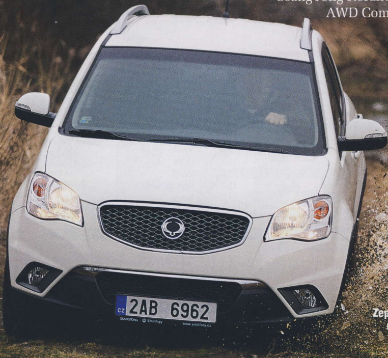
Zepředu je korando nejpohlednějším ssangyongem.